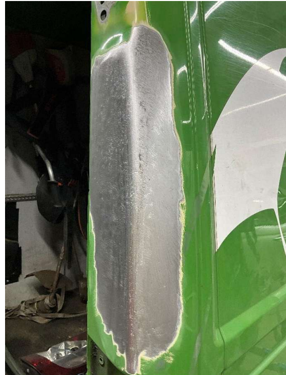
Abbildung 2: Blechinstandsetzung abgeschlossen [MRM fair claim GmbH]