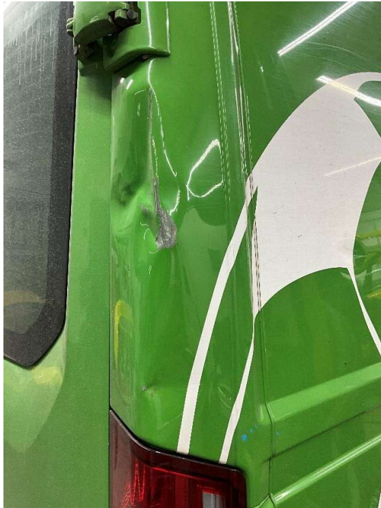
Abbildung 1: Originalschaden vor Instandsetzung