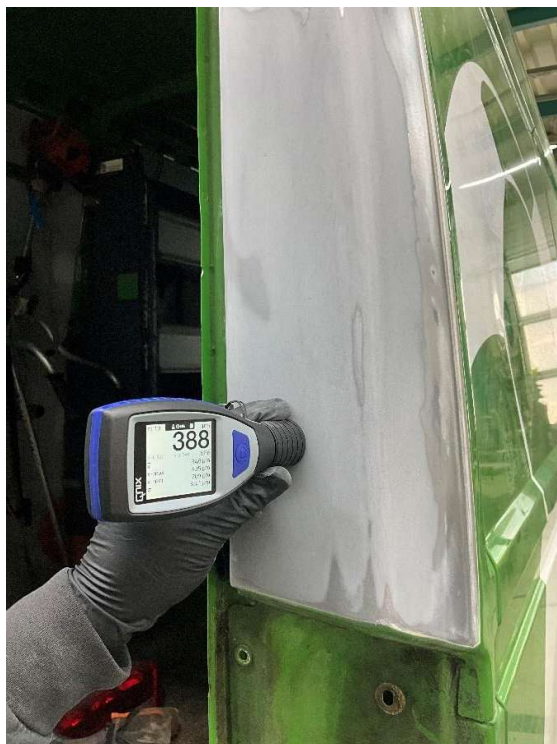
Abbildung 3: Schichtdickenmessung nach Auftrag von Karosseriefüllmasse / Schwemzinnersatzmaterial [MRM fair claim GmbH]